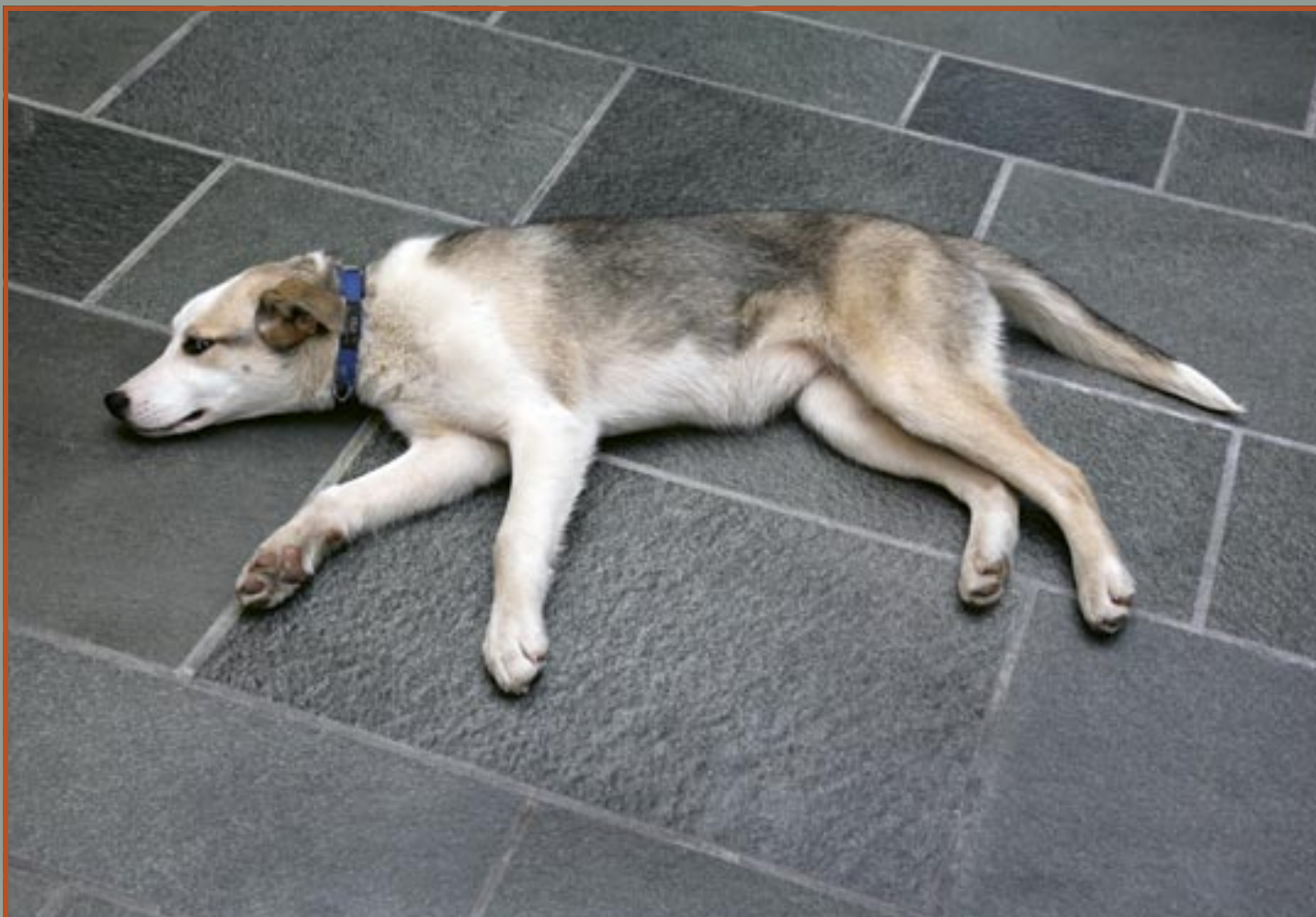
Flis i Altaskifer med naturplan.