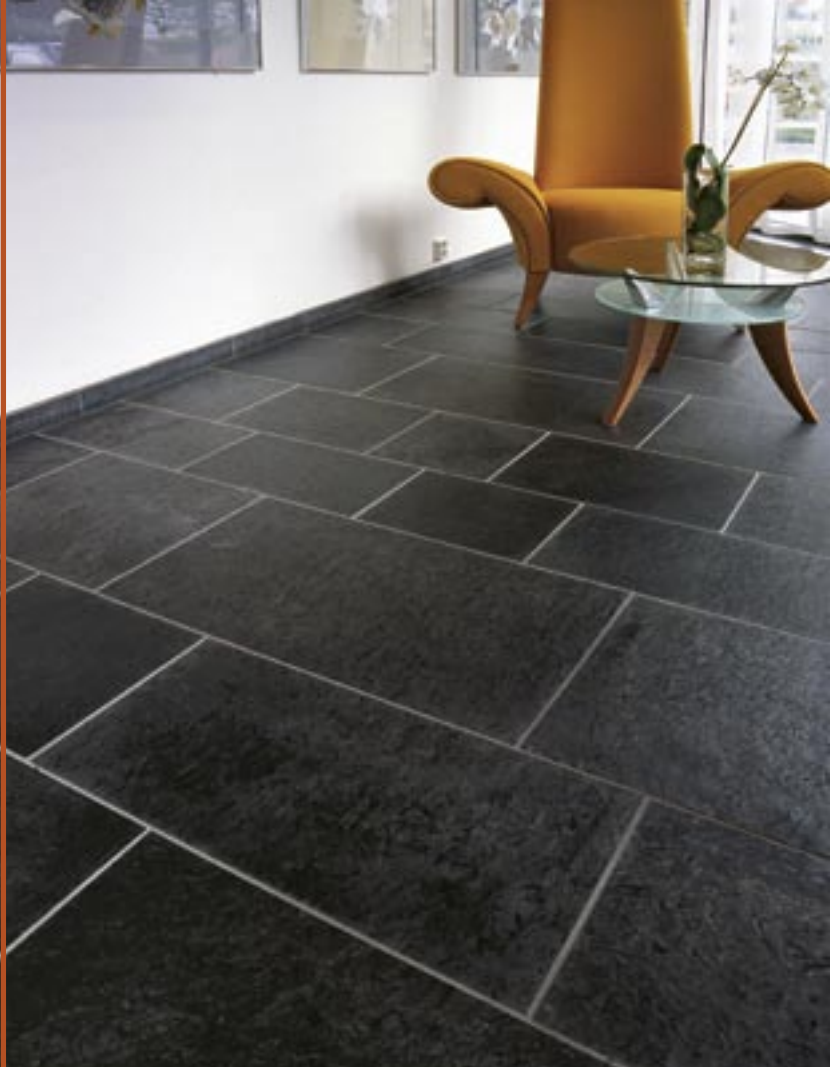
Flis og sokkellist i Ottaskifer (Pillarguri) med slipt plan.