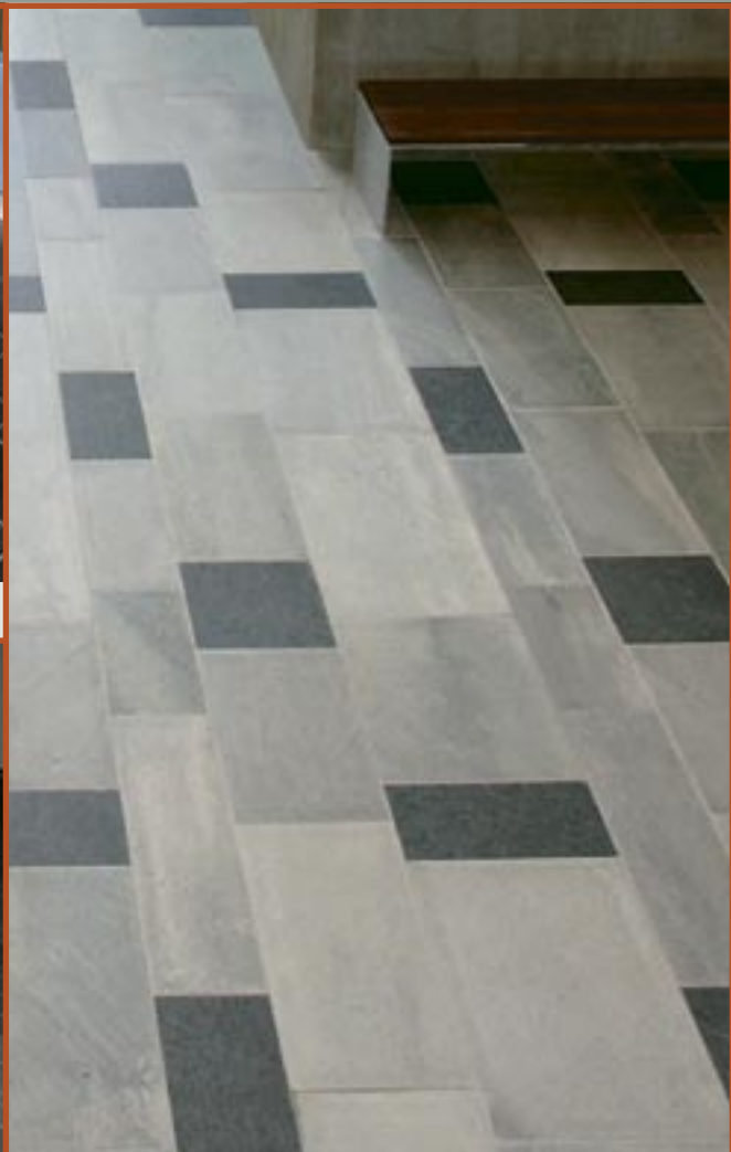
Flis i Oppdal- og Ottaskifer med børstet plan.