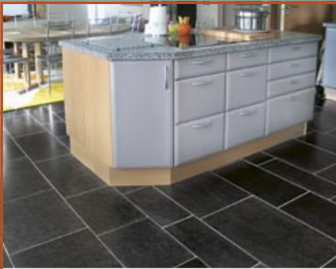
Flis i Ottaskifer (Pillarguri) med slipt plan.