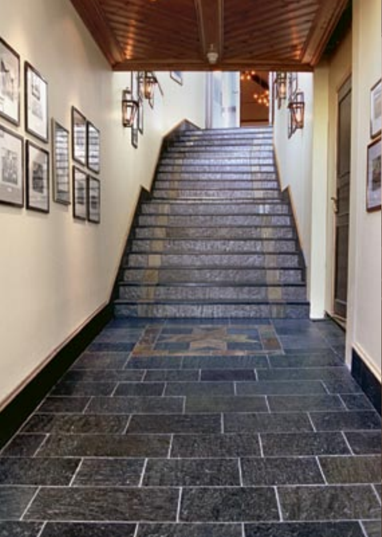
Flis og trinn i Ottaskifer med naturplan.