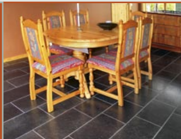
Flis i Ottaskifer (Pillarguri) med slipt plan.

Skiferen tåler alle påkjenninger i vår daglige bruk - livet ut. Overflaten er vakker og vedlikeholdsfri.