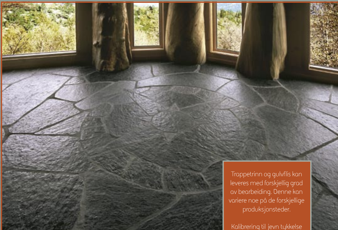
Bruddheller i Ottaskifer med naturplan.

Trappetrinn og gulvflis kan leveres med forskjellig grad av bearbeiding. Denne kan variere noe på de forskjellige produksjonsteder.