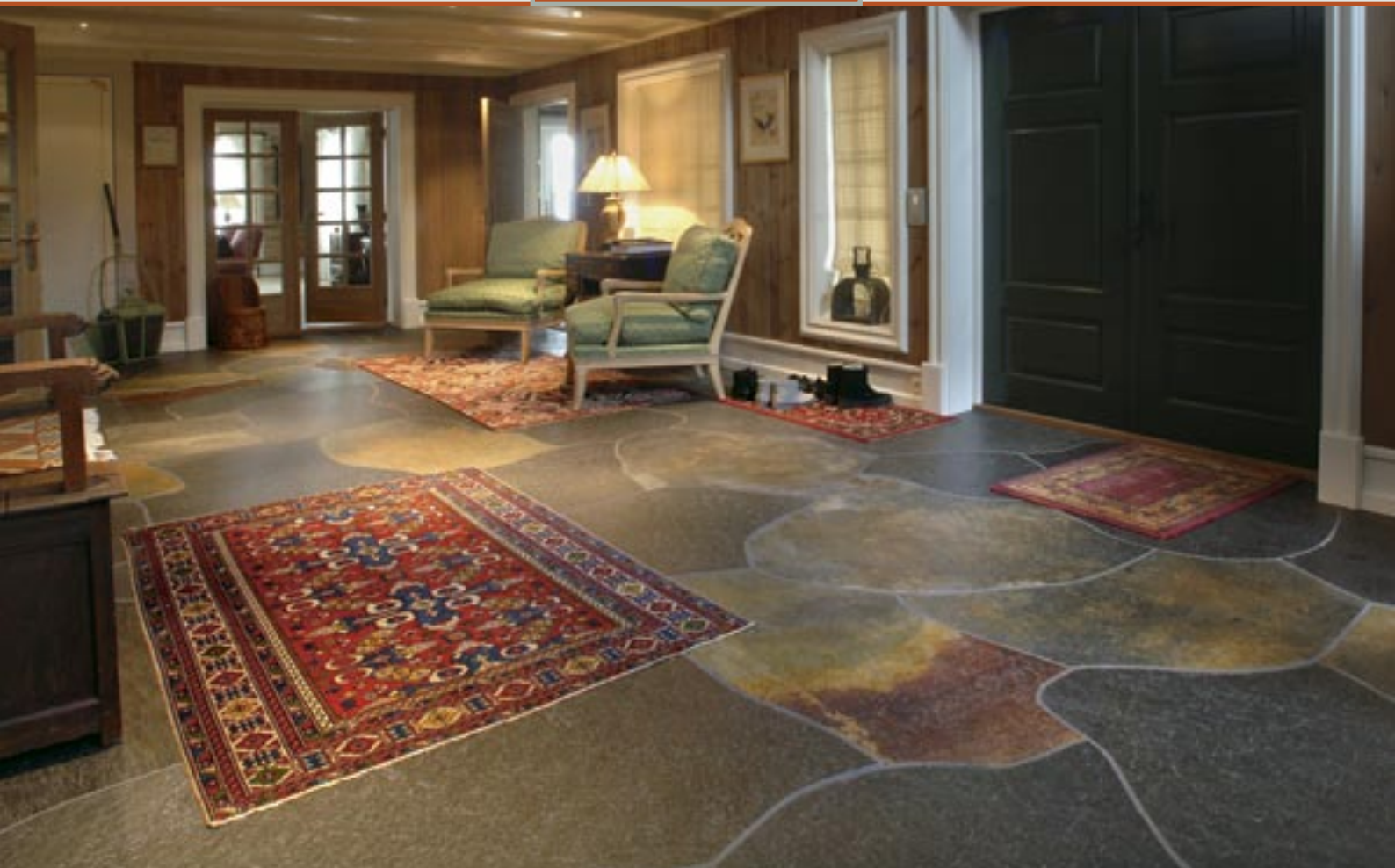
Maxi bruddheller i Ottaskifer med naturplan.