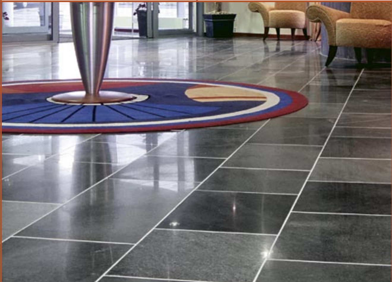
Flis i Altaskifer med slipt plan.