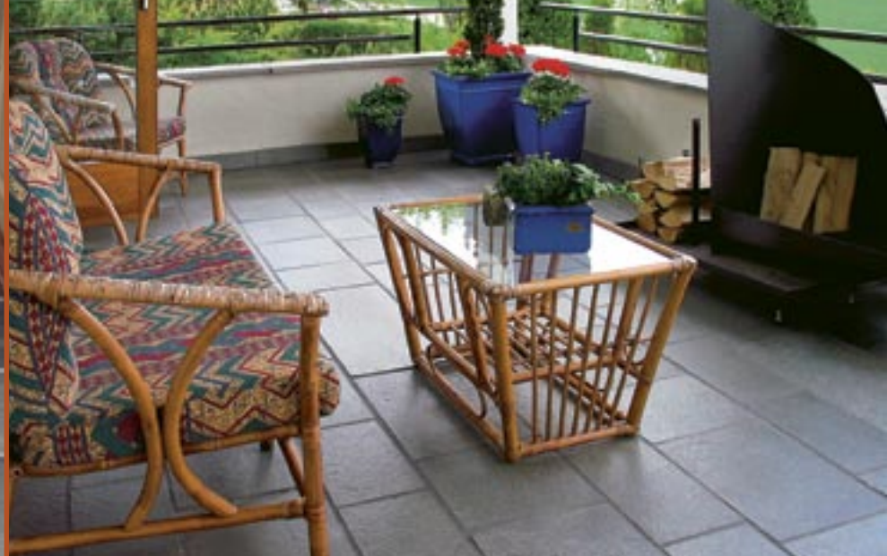
Flis i Altaskifer med naturplan.