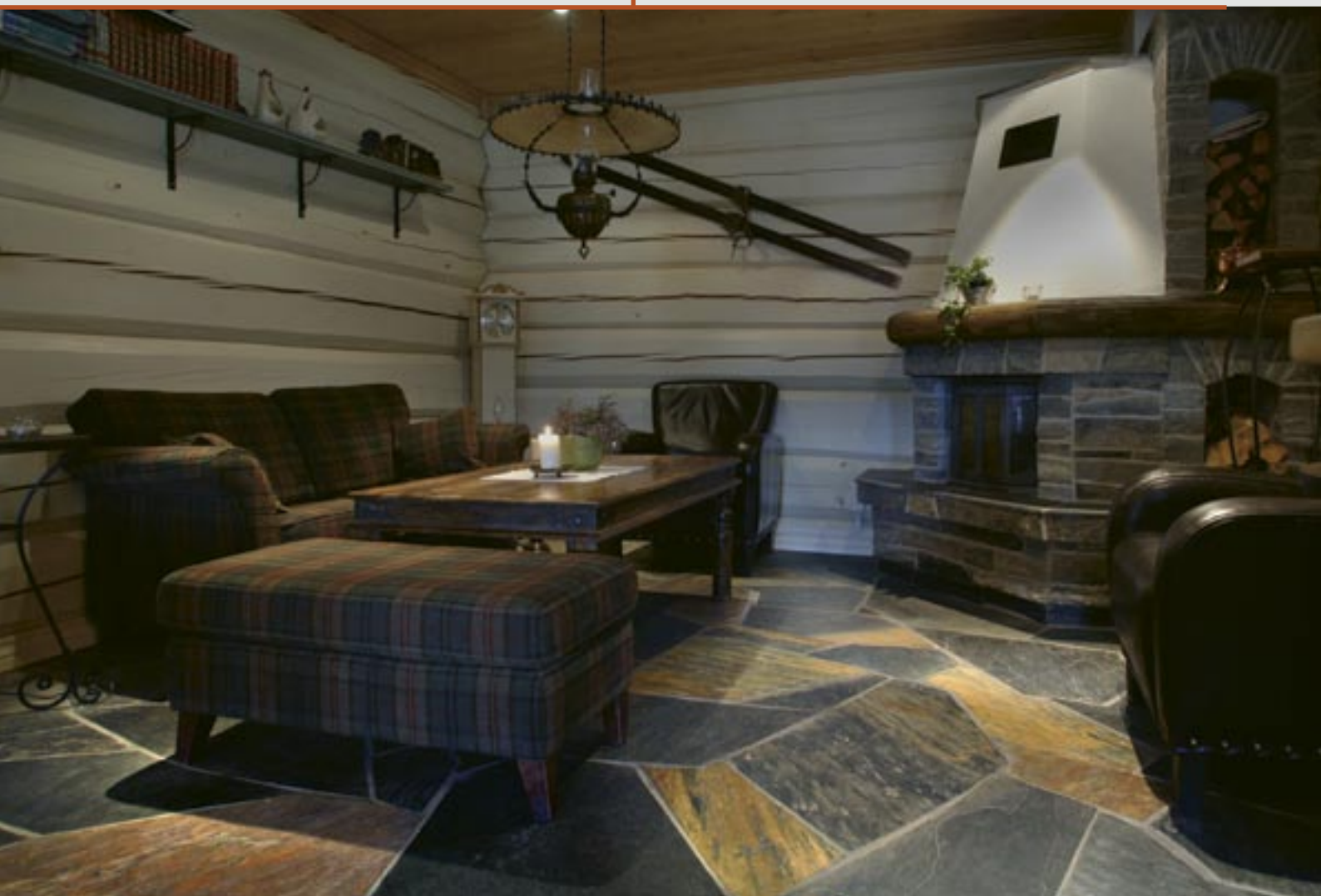
Bruddheller i Ottaskifer med naturplan.