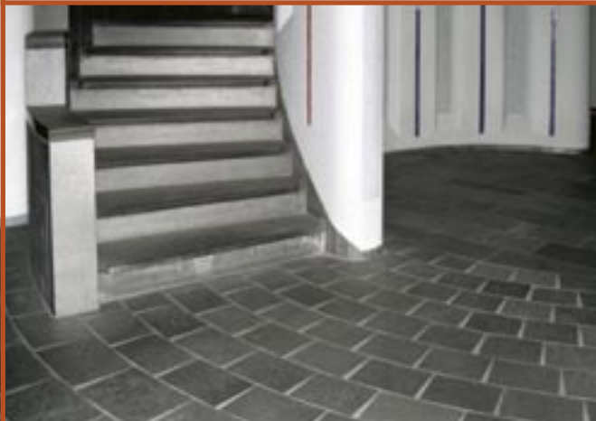
Flis og trinn i Altaskifer med naturplan.