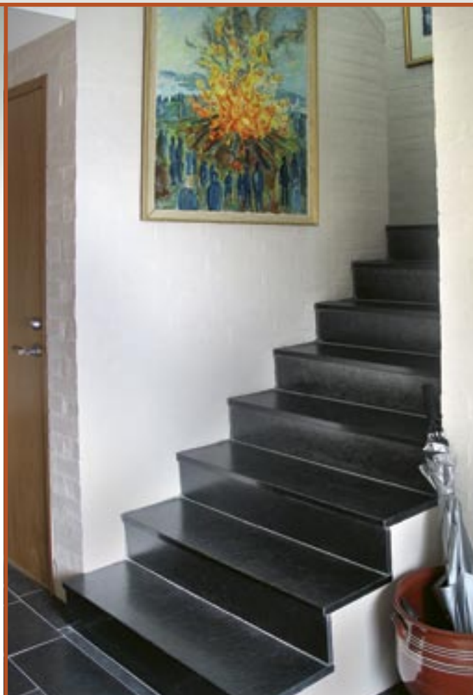
Trinn og flis i Ottaskifer (Pillarguri) med slipt plan.

Velger du i tillegg behagelig gulvarme under flis eller bruddheller så har du lagt favorittgulvet for deg og dine + eventuelle fribente venner.